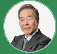
薬学博士 杉本八郎 監修